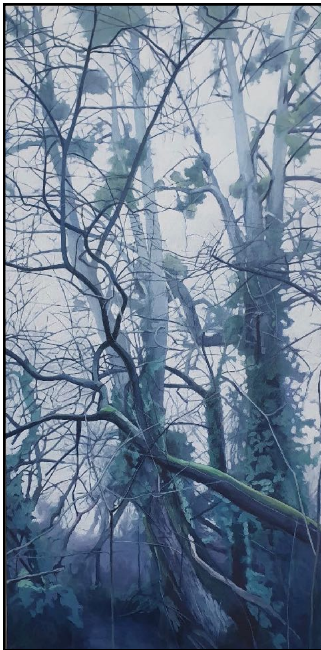
Le petit bois de la Gourdoire 6, acrylique sur toile, 2024, 100x50 cm Le petit bois de la Gourdoire 7, acrylique sur toile, 2024, 100x50 cm