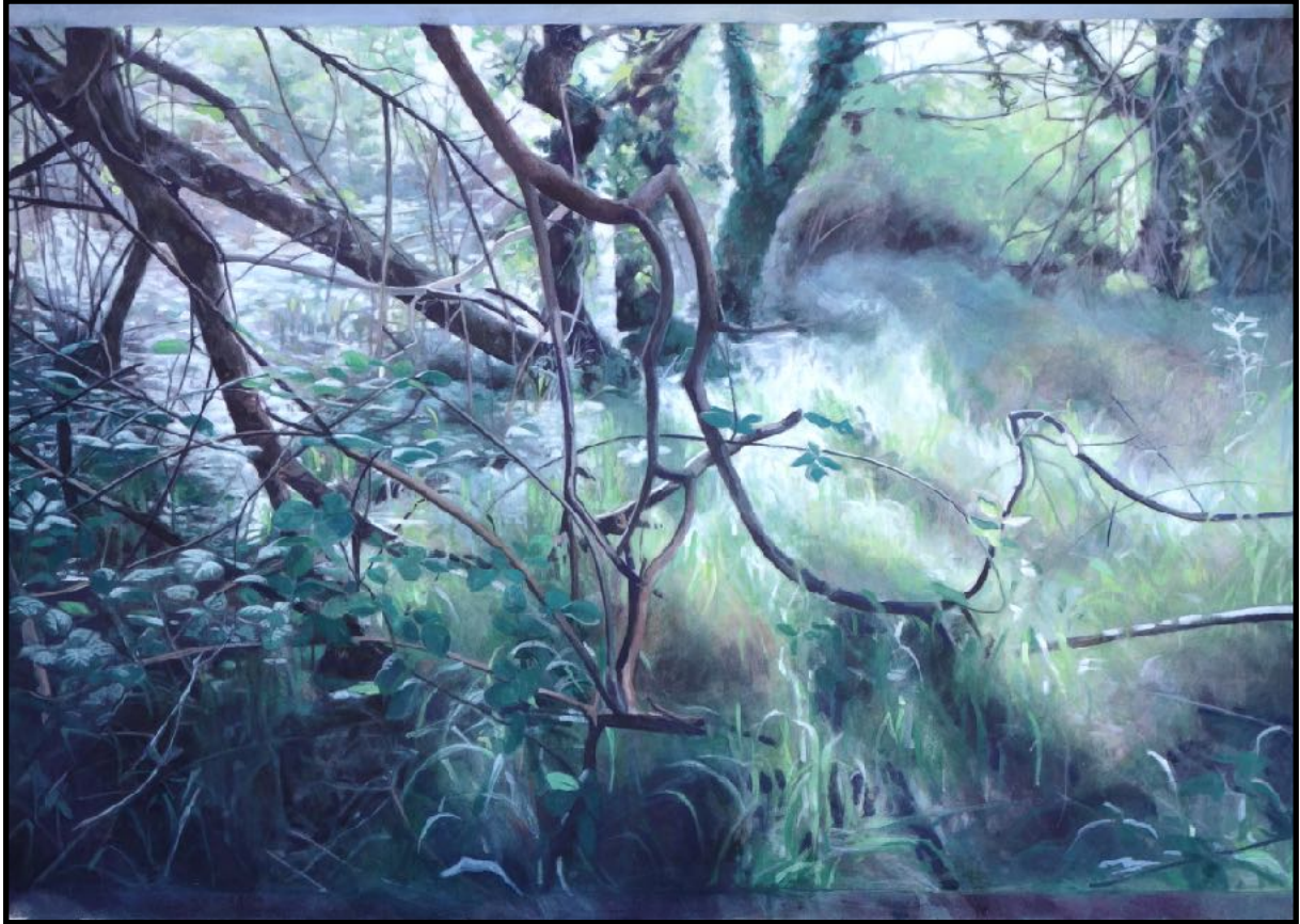
La Gourdoire 4, acrylique sur toile, 2024, 72x102 cm

Tel: 06 74 41 03 63 Mail: ghislaine@eonnnetdupuy.com