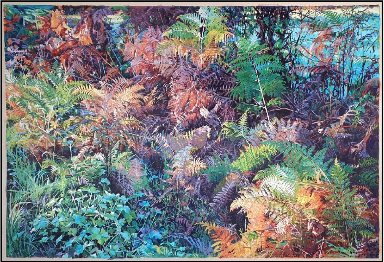
Fougères - automne, 2022, acrylique sur toile libre, (145x190 cm)

Tel: 06 74 41 03 63 Mail: ghislaine@eonnetdupuy.com