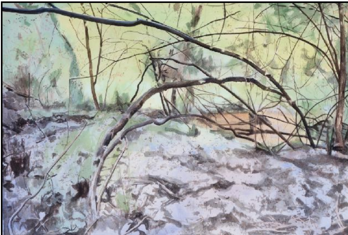
La Gourdoire 1, acrylique sur toile, 2023, 95x148 cm

Tel: 06 74 41 03 63 Mail: ghislaine@eonnnetdupuy.com