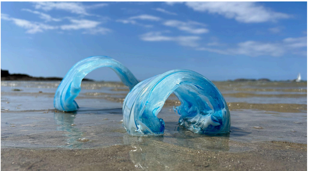
Fragments IV 45x14x14cm Oeuvre unique Collection privée