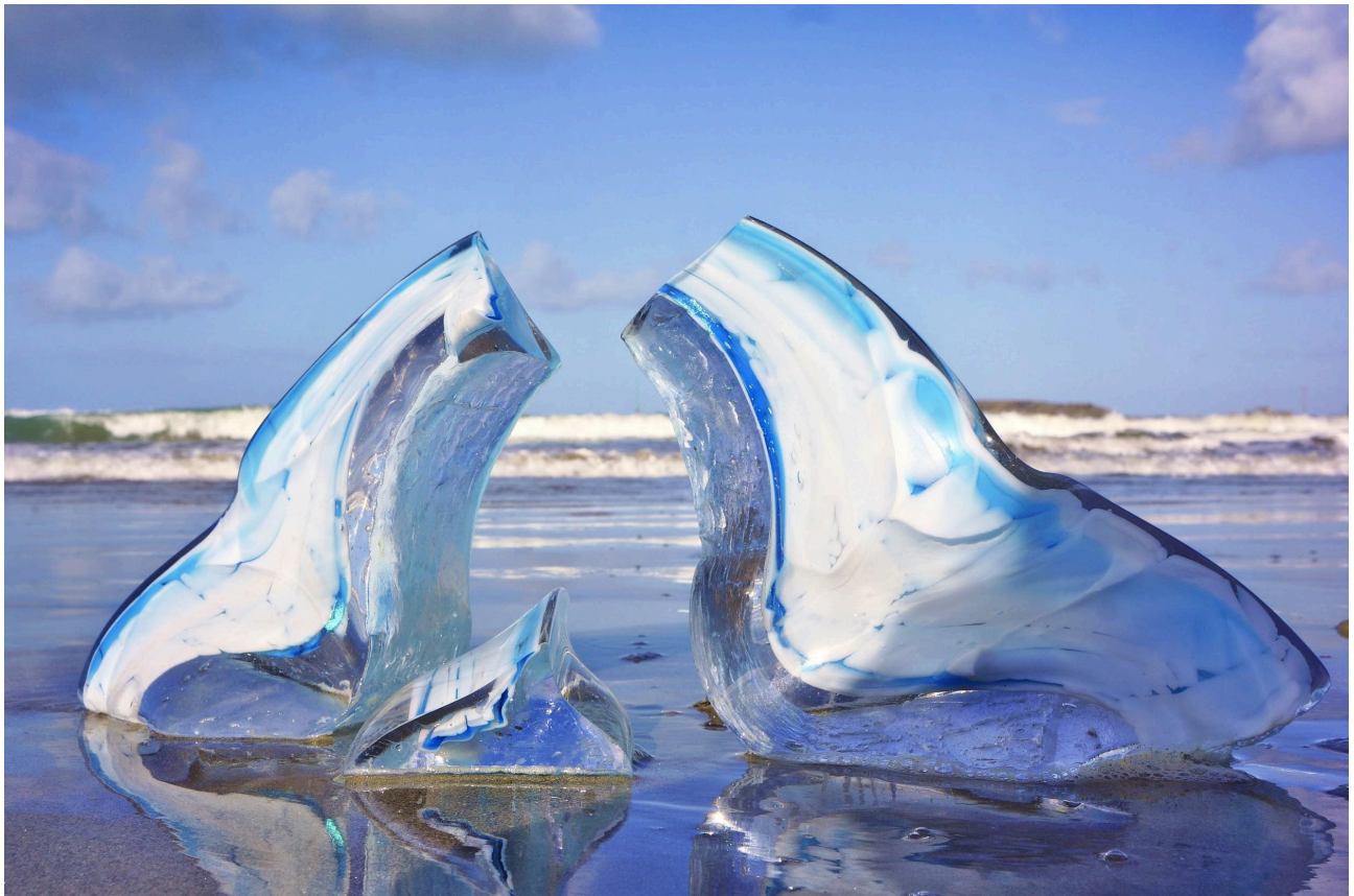
Fragments VIII 40x30x12 cm Oeuvre unique