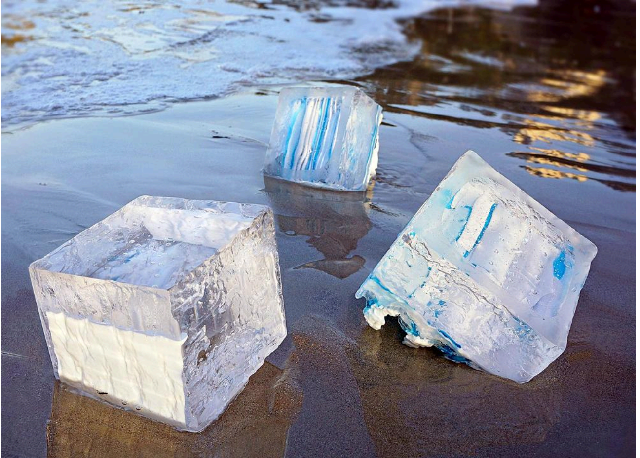
Fragments Plage de l'écluse Dinard 2015