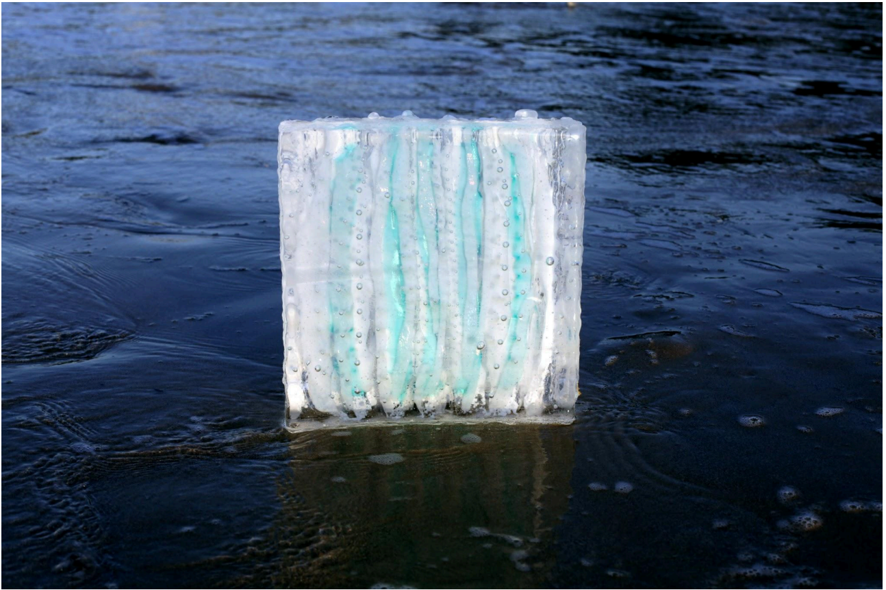
Fragments IV 30x30x8cm Oeuvre unique Collection privée © Didier Lecoq