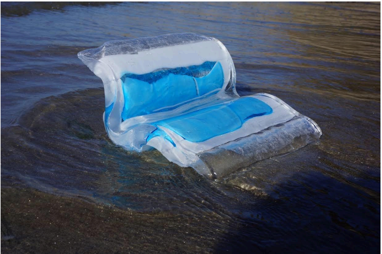
Fragments IV 30x30x8cm Oeuvre unique XIII