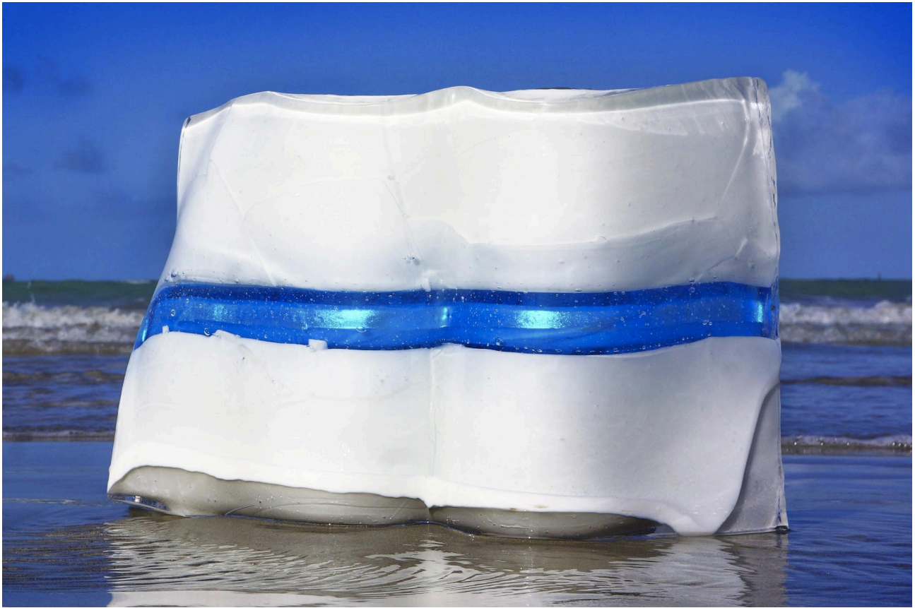
Fragments XI 50x29x10cm Oeuvre unique