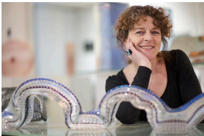
Portrait