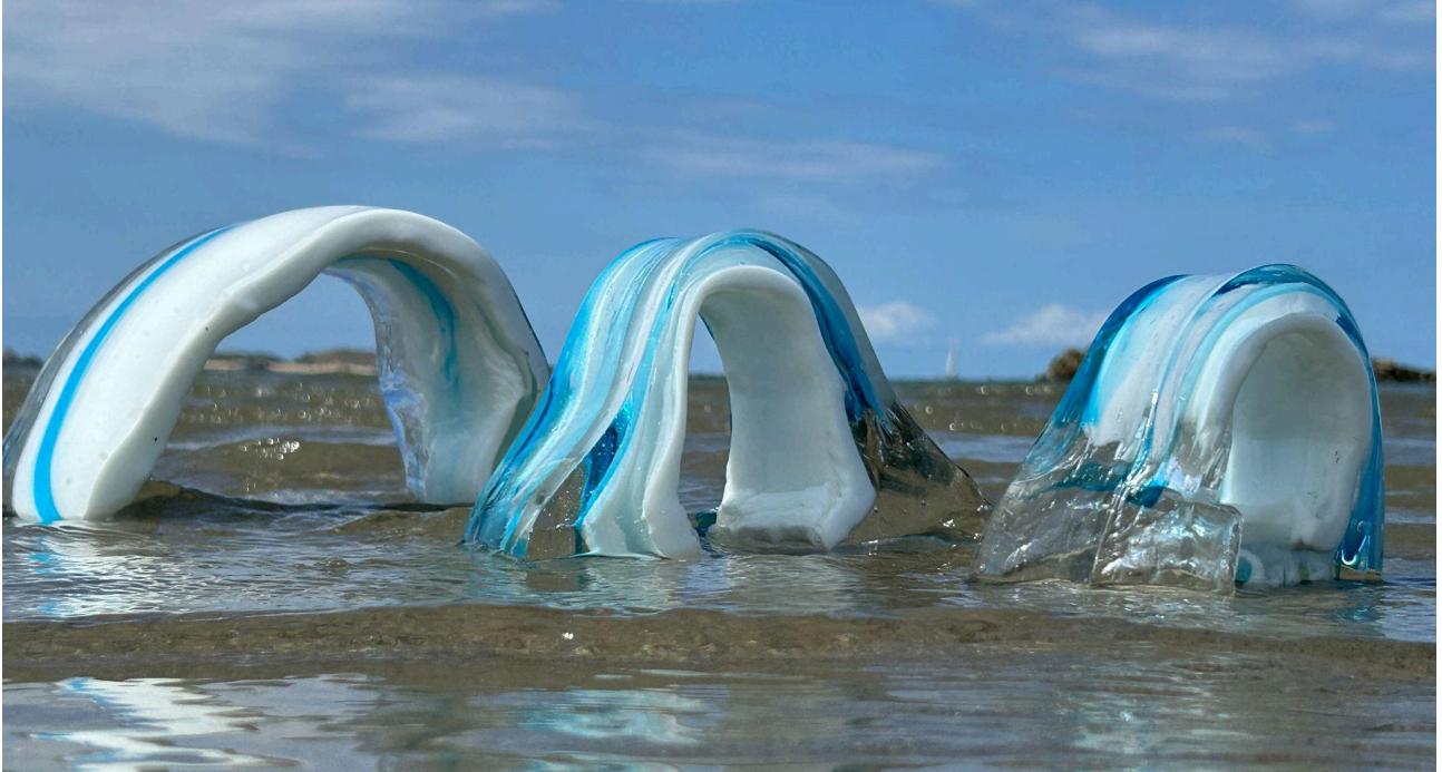
Fragments III 28x11x18 cm Oeuvre unique Collection privée